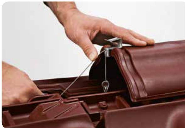
SCHRITT 2 Unter den letzten Dachlatten fixieren, Draht spannen und umbiegen