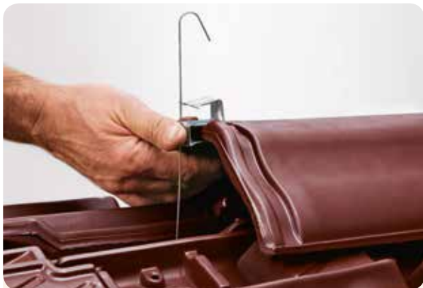
SCHRITT 1 Kopfklammer anbringen