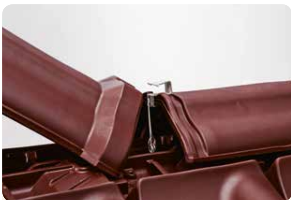
SCHRITT 3 Nächsten First einsetzen