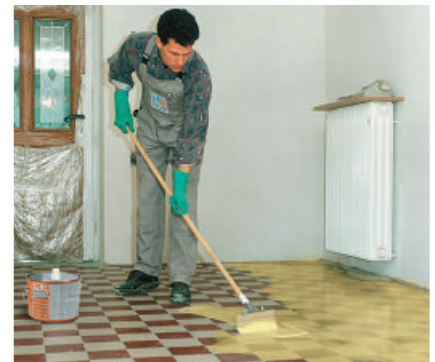
PCI Gisogrund 303 ist die sichere Haftgrundierung zum Verlegen von Belägen auf keramischen Fliesen und Platten.