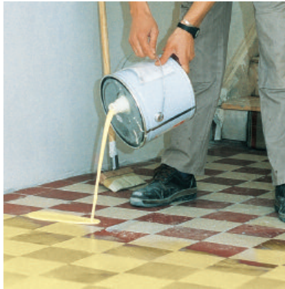
PCI Gisogrund 303 gründlich aufschütteln und auf den Untergrund ausgießen.

2 Grundierung z. B. mit Flächenstreicher, weichem Haarbürsten oder Quast auf dem Untergrund verteilen und im „Kreuzgang dünn auftragen. Pfützen vermeiden!“ (Verbrauch: ca. 90 bis 130 ml/m 2 ).