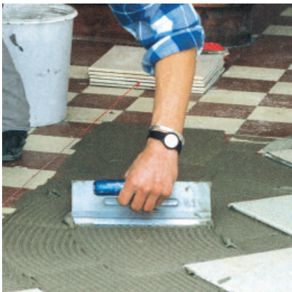
Nach ca. 30 bis 45 Minuten können nachfolgende Oberbeläge mit PCI-Fliesenklebern aufgebracht werden.