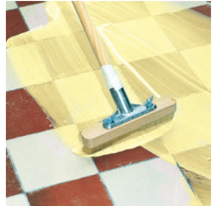
Grundierung auf dem Untergrund im „Kreuzgang“ vollflächig verteilen.

3 PCI Polycrret 5 bzw. PCI Pericret oder PCI-Fliesenkleber zur Verlegung von keramischen Fliesen- und Plattenbelägen auf die abgelüftete und ausgehärtete Grundierung aufbringen!