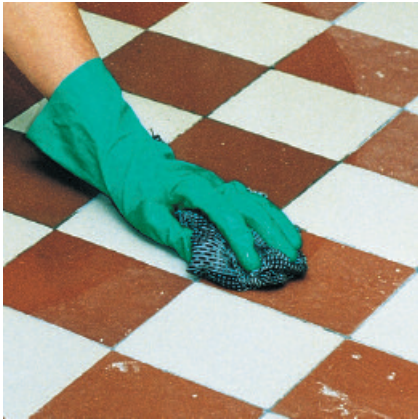
Untergrund mit geeignetem Reiniger von haftungsmindernden Rückständen säubern.

1 PCI Gisogrund 303 gründlich aufrühren bzw. aufschütteln.