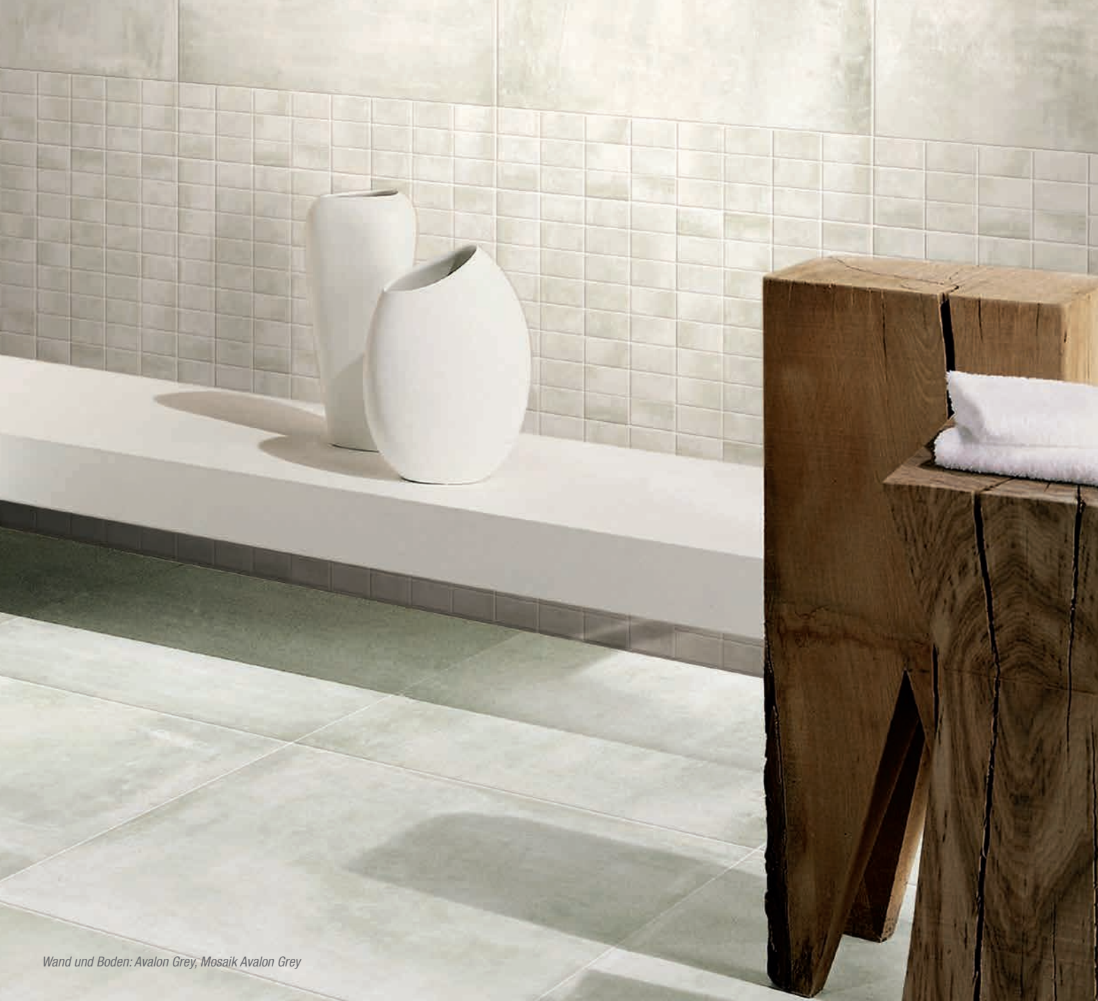
Wand und Boden: Avalon Grey, Mosaik Avalon Grey

Stand Oktober 2019, Art.-Nr. 8500150 Farbabweichungen aus drucktechnischen Gründen möglich. Technische Änderungen vorbehalten.