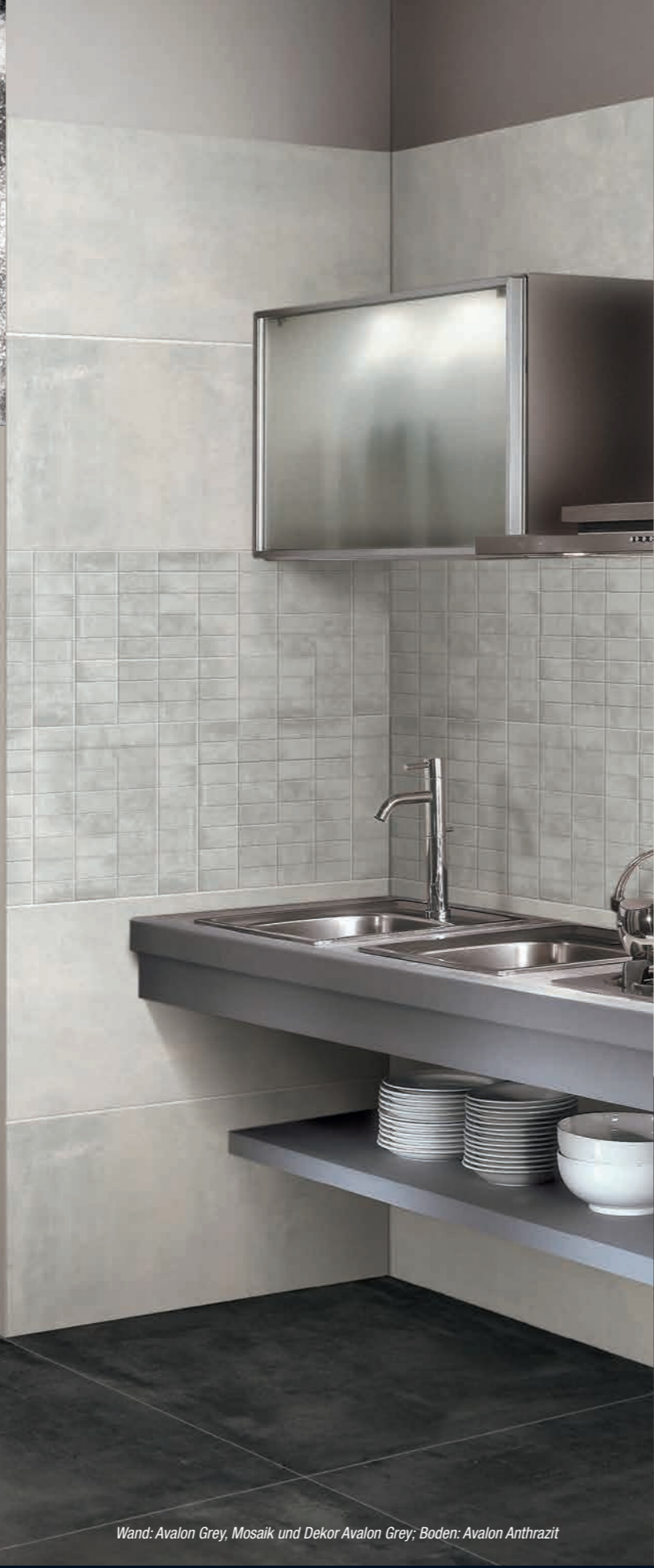
Wand: Avalon Grey, Mosaik und Dekor Avalon Grey; Boden: Avalon Anthrazit