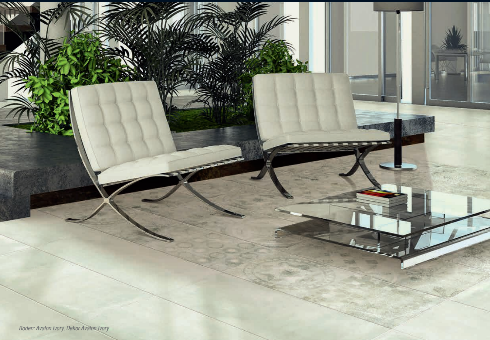
Boden: Avalon Ivory, Dekor Avalon Ivory