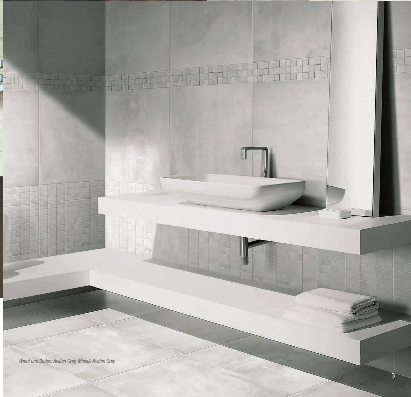
Wand und Boden: Avalon Grey, Mosaik Avalon Grey