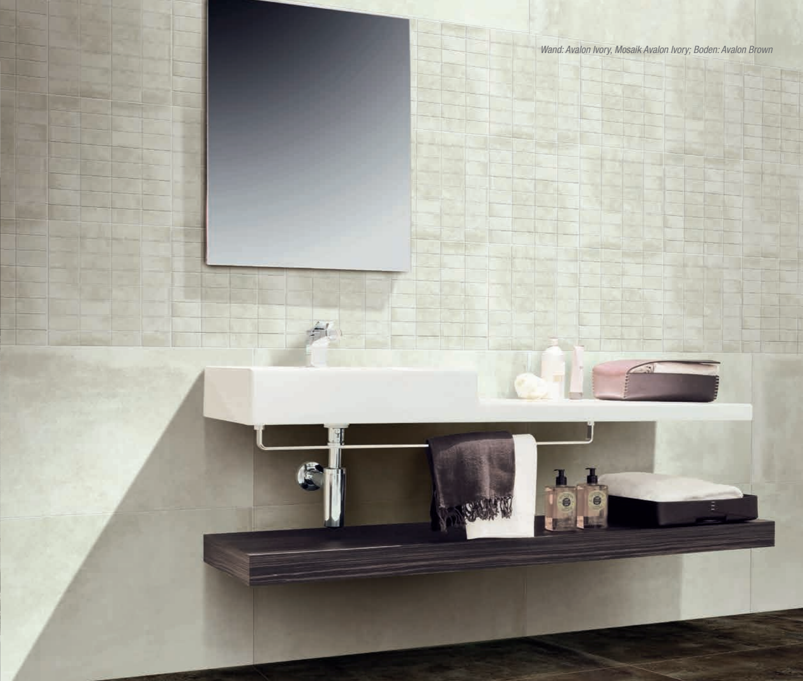
Wand: Avalon Ivory, Mosaik Avalon Ivory; Boden: Avalon Brown