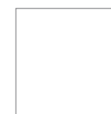
80 x 80 cm (80,2 x 80,2 cm)